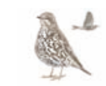
● Zorzal charlo ( Turdus viscivorus ) ● Mistle Thrush