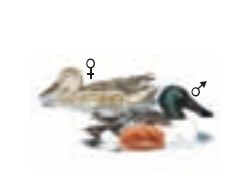
● Cuchara común ( Anas clypeata ) Northern Shoveler