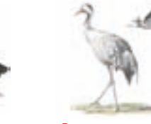
● Grulla común ( Grus grus ) ● Common Crane