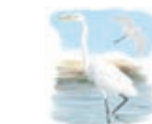
● Garceta común ( Egretta garzetta ) Little Egret