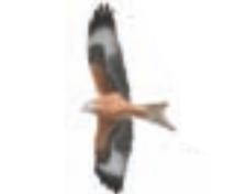
● Milano real ( Milvus milvus ) ● Red Kite