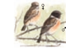
● Tarabilla común ( Saxicola torquata ) Stonechat