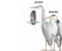
● Garza real ( Ardea cinerea ) Grey Heron