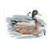
● Ánade azulón ( Anas platyrhynchos ) Mallard