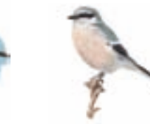
● Alcaudón real ( Lanius meridionalis ) ● Southern Grey Shrike