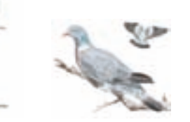
● Paloma torcaz ( Columba palumbus ) ● Common Wood Pigeon