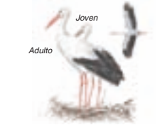
● Cigüeña blanca ( Ciconia ciconia ) White Stork