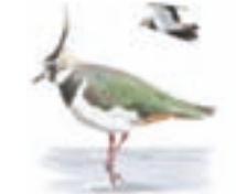
● Avefría europea ( Vanellus vanellus ) Northern Lapwing