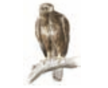
● Busardo ratonero ( Buteo buteo ) ● Common Buzzard