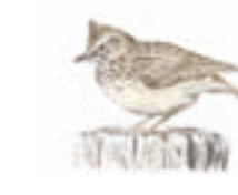
● Cogujada montesina ( Galerida theklae ) Thekla Lark