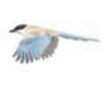
● Rabilargo ibérico ( Cyanopica cookii ) Azure-winged Magpie