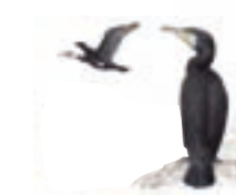
● Cormorán grande ( Phalacrocorax carbo ) Great Cormorant