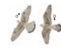
● Cernicalo vulgar ( Falco tinnunculus ) ● Common Kestrel