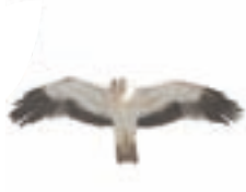
● Águila calzada ( Aquila pennata ) Booted Eagle