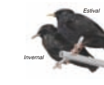
● Estornino negro ( Sturnus unicolor ) Spotless Starling