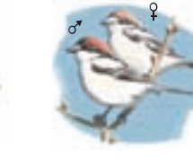
● Alcaudón común ( Lanius senator ) Woodchat Shrike