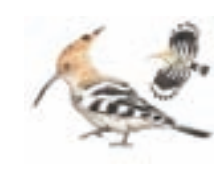
● Abubilla ( Upupa epops ) Hoopoe