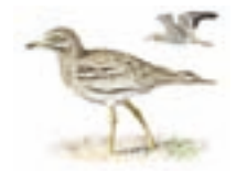
● Alcaraván común ( Burhinus oedicnemus ) Stone-curlew