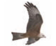
● Milano negro ( Milvus migrans ) Black Kite