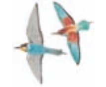
● Abejaruco europeo ( Merops apiaster ) European Bee-eater