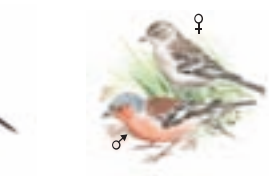
● Pinzón vulgar ( Fringilla coelebs ) Common Chaffinch