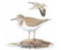
● Andarrios grande ( Tringa ochropus ) ● Green Sandpiper