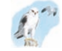
● Elanio común ( Elanus caeruleus ) Black-winged Kite