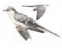
● Críalo europeo ( Clamator glandarius ) Great Spotted Cuckoo