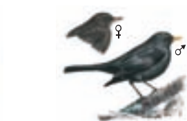
● Mirlo común ( Turdus merula ) Common Blackbird